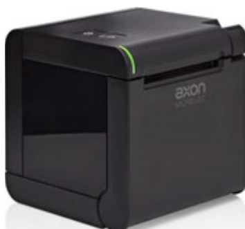
Uscita carta superiore