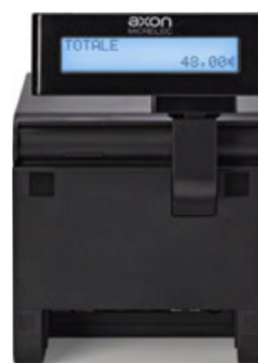
Display cliente integrato