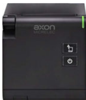
Uscita carta frontale