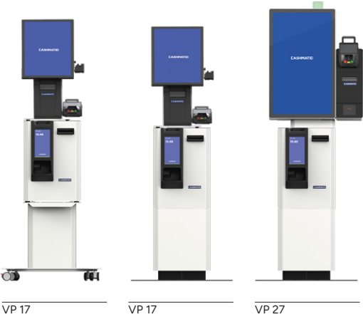
VP 17 VP 17 VP 27 SP 460 SP 460 SP 460 Stand mobile basso (M-L) Stand fisso (F4) Stand fisso (F4)